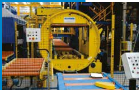
Linha Completa de Moldagem Fast Loop