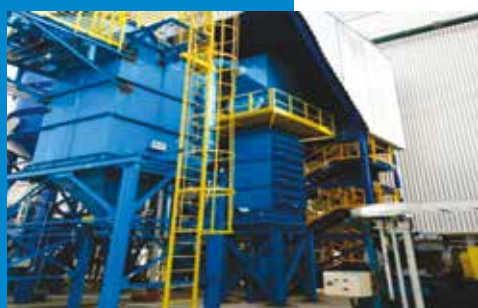
Recuperação Mecânica e Regeneração Térmica de Areia