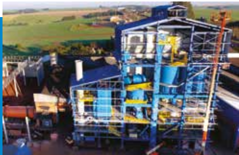
Preparação e Recuperação de Areia