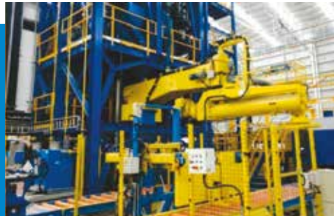
Misturador Contínuo de Diversas Capacidades