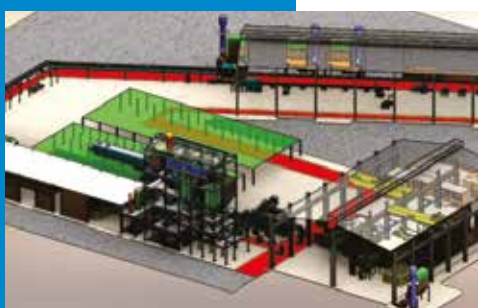
Engenharia e Gerenciamento de implantação