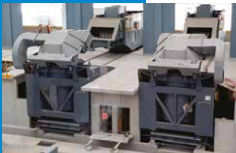
Carregamento de Forno com Exaustão