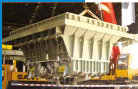
Sistemas de Desmoldagem e Exaustão